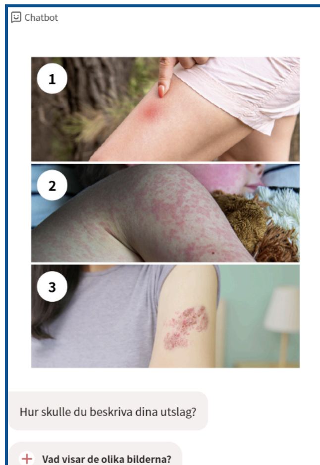
Bild som visar typer av utslag i formuläret utslag .

En bild är tillagd i formuläret utslag för att tydliggöra tolkningen av de val som finns för olika typer av utslag.